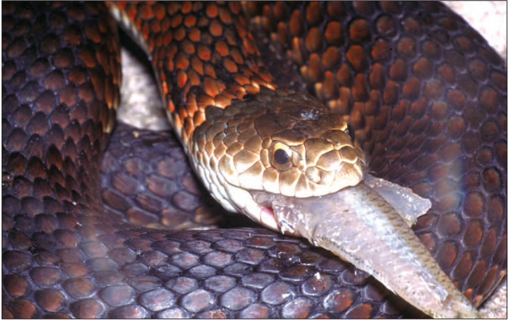
Austrelaps superbus

betreft is geen enkel deel van Melbourne te warm voor deze soort. Normaal gezien zijn copperheads het talrijkst aanwezig in gebieden waar geen andere soorten voorkomen. Dit kan zowel te maken hebben met hun koudetolerantie, als met het feit dat andere slangensoorten hoger lijken te staan in de pikorde.